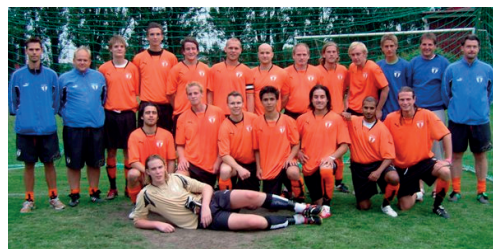
Torns IF:s A-lag i juni år 2007

Årets höjdpunkt var dock utan tvekan matchen mot Lunds BoIS borta på Klostergårdens IP i den fjärde omgången från