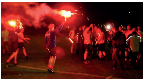
Torn firar avancemanget efter vinsten mot Lunds BoIS

slutet. Matchen spelades på kvällen fredagen den 7 september och Torn ledde serien med tio poängs marginal och hade alltså möjlighet att definitivt säkra seriesegern.