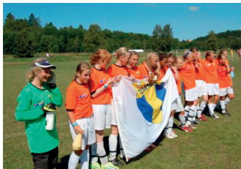
Gothia Cup 2009

Torns IF har alltid haft många ungdomslag som deltagit i utomhusserier och i olika inomhusturneringar runt om i Skåne.