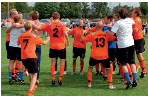
Segerdans efter vinst i seriefinalen mot Staffanstorp

matchen före uppehållet gick Torn till sommarvila som serieledare. Man var tätt följda av Staffanstorp och Veberöd. Längre ner i tabellen hade seriens förhandsfavoriter Kulladal börjat få upp farten och var sex poäng bakom Torn.