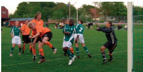
Hemmaseger mot Lunds FF i maj

Torn med 4-3 efter en svag insats på en åker i Gunnarstorp och därmed var man utslagna ur DM. På helgen samma vecka var det seriepremiär och det blev på nytt förlust med 4-3, denna gång borta mot Bara GIF.