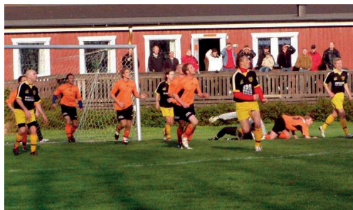
Hemmvinst i prestigemötet mot Örtofta IS under vårens segerrad

terades tack vare Rönningbergs kontakter och det gav mycket publicitet i media att få en så pass meriterad spelare som tränare. Rutinerade spelaren Ola Dahlström blev assisterande tränare till Peo som också spelade själv under större delen av säsongen.