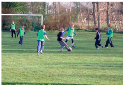
P99:s träning i full gång.