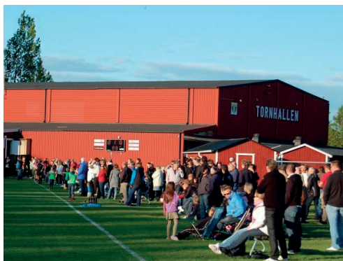
Storpublik när Malmö FF gästade Tornvallen

Torn avslutade seriespelet snyggt med tre raka segrar, vilket innebar att man sluta-