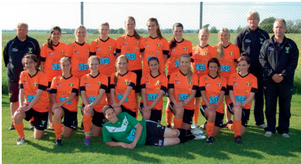
Damlaget vårsäsongen 2013

Efter säsongen 2012 skulle seriesystemet göras om och division 5 skulle försvinna. Därmed slogs topplagen i Torns serie om en plats i division 3. Först såg det inte ut som om Torns tredjeplats skulle räcka, men det visade sig att det gjorde det eftersom lag högre upp i seriesystemet drog sig ur. Torn var därmed klara för division 3!