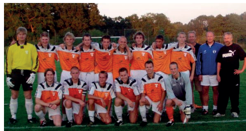
Torns IF:s A-lag i höstpremiären år 2004