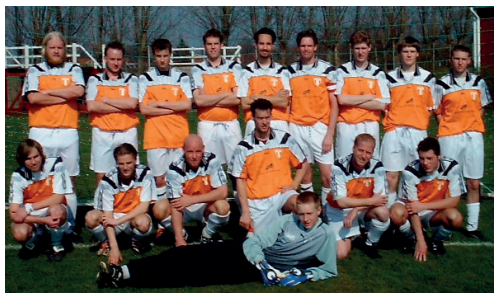
Torns IF:s A-lag i seriepremiären år 2002