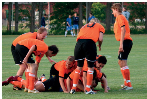
Jubel i Torn efter mål hemma mot Marieholm

Därefter kom en liten vändning när Torn vann tre raka matcher, med den sammanlagda målskillnaden 13-1! Den största bedriften var kanske när storfavoriterna och