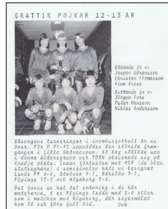
Saxat ur TORNADO nr 52-84