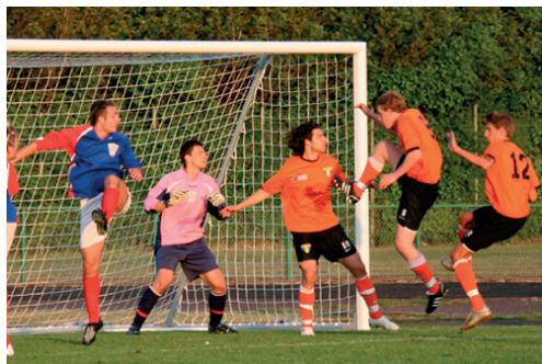
Torns bortavinst mot FBK Balkan 2008

för Helsingborgs IF efter säsongen 1999 och därefter även hunnit med några säsonger i Lunds BK.