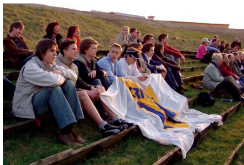
Tornsupportrar på plats på premiären på Klostergården.