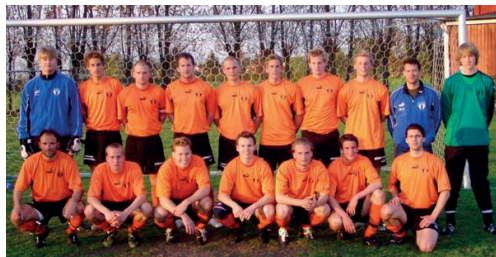
Torns IF:s A-lag i maj år 2005