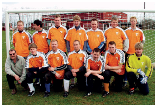
Torns IF:s A-lag år 2001

De fick överta laget efter att klubben degraderats till den lägsta divisionen, division 7. Efter förra säsongen lämnade flera av de rutinerade spelarna och det var med en mycket tunn trupp som Torn gick in i säsongen 2001, något reservlag fanns