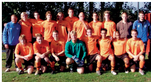
Torns IF:s A-lag efter serieavslutningen år 2006