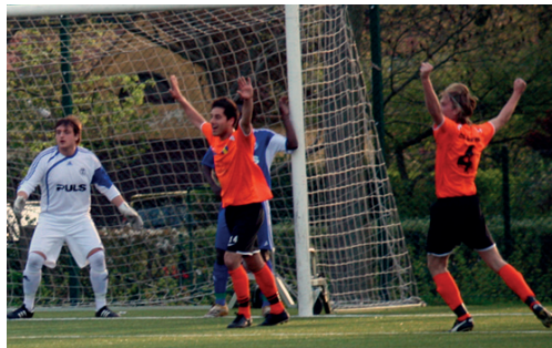
Måljubel i bortamatchen mot Lunds SK

När serien drog igång fick Torn en hyfsad start med oavgjort i premiären mot